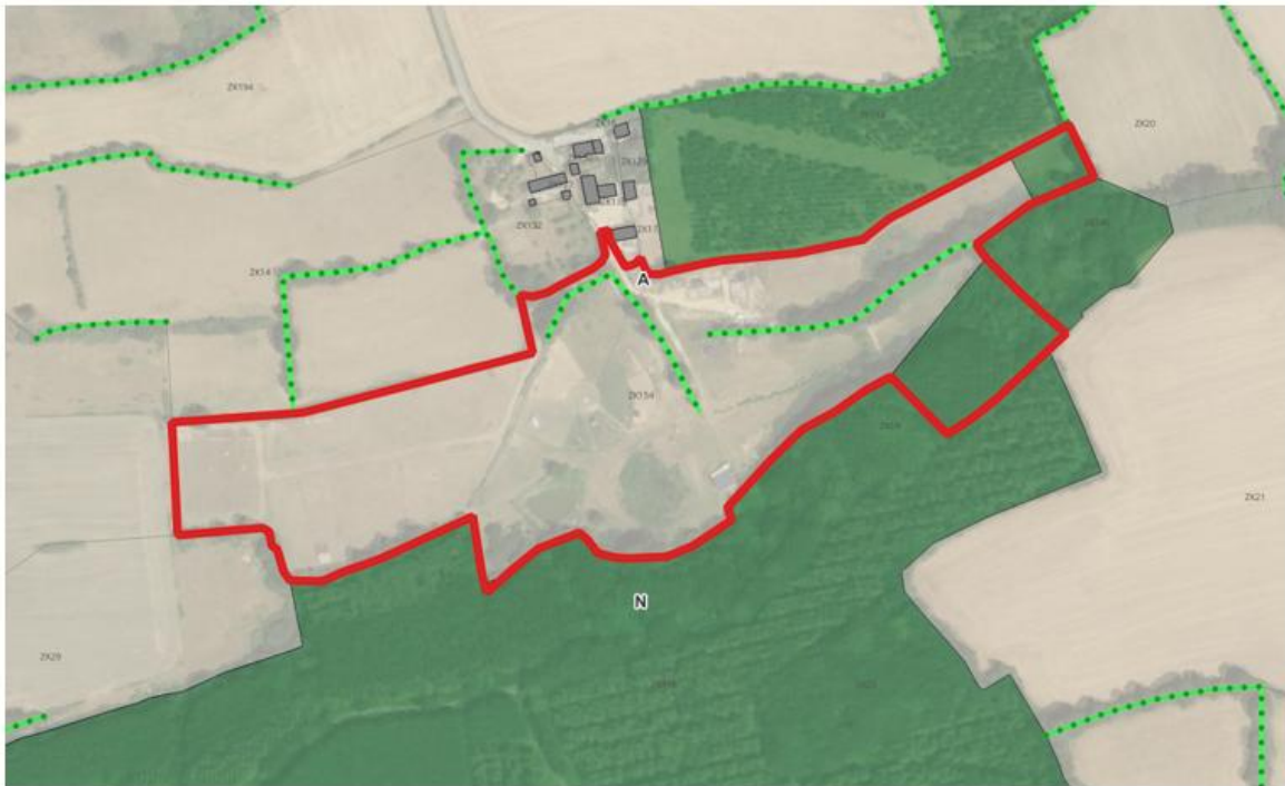
Superposition des parcelles concernées par le projet avec le zonage en vigueur du PLUi