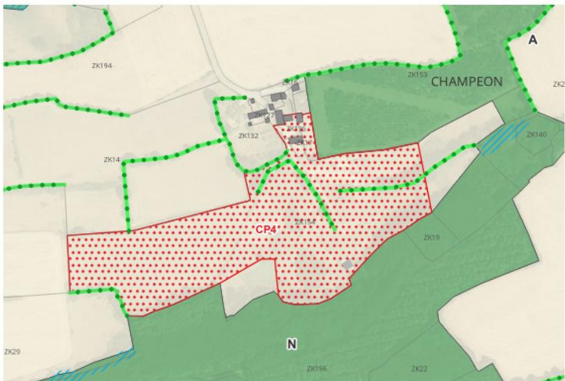
Extraits du plan de zonage après modification

Vu le code général des collectivités territoriales, Vu le code de l'environnement, Vu le code de l'urbanisme, Vu le Plan Local d'Urbanisme intercommunal (PLUi) de Mayenne Communauté approuvé par délibération du conseil communautaire en date du 4 février 2020,