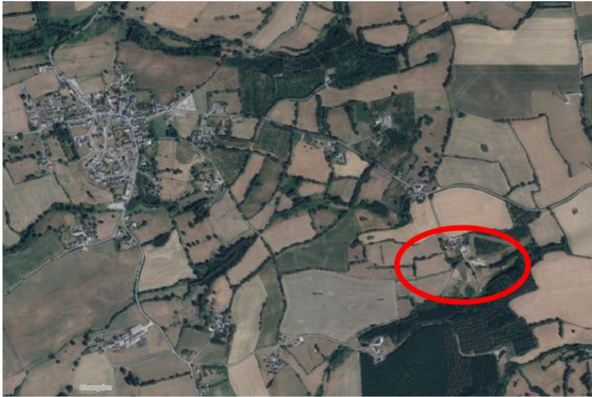
Localisation du site par rapport au bourg de Champéon