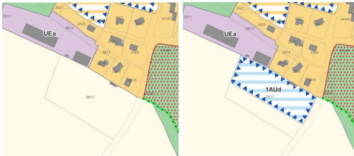
Extrait du plan de zonage avant et après modification

La zone 1AUd est créée pour l'occasion, et comme chaque zone 1AU doit faire l'objet d'une Orientation d'Aménagement et de Programmation (OAP) permettant de définir des principes d'aménagement, une OAP spécifique est créée par la présente procédure.