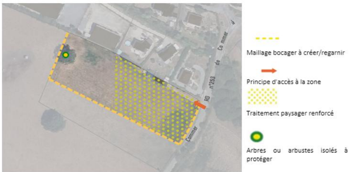
Extrait de l'OAP créée par la modification