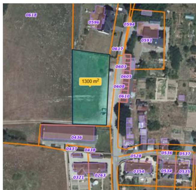
Espace prévu pour l'aménagement du parking et actuellement en zone A dans le PLUi

Aujourd'hui, une moitié de cette surface est déjà à usage de zone de stationnement. L'autre moitié générant de la consommation d'espace NAF, elle doit être compensée par la réduction de la zone 1AUh de la Draumerie.