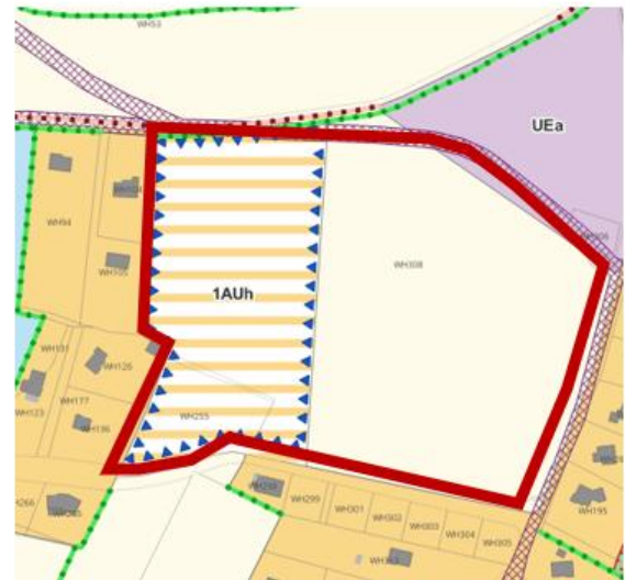
Extrait du règlement graphique avant et après la révision

Vu le code général des collectivités territoriales, Vu le code de l'environnement, Vu le code de l'urbanisme, Vu le Plan Local d'Urbanisme intercommunal (PLUi) de Mayenne Communauté approuvé par délibération du conseil communautaire en date du 4 février 2020, Vu l'arrêté n°2020-AG-08 du conseil communautaire du 7 juillet 2020 approuvant la mise à jour du PLUi de Mayenne Communauté, Vu la délibération du conseil communautaire du 31 mars 2022 approuvant la modification simplifiée n° 1 du PLUi de Mayenne Communauté, Vu la délibération du conseil communautaire du 9 février 2023 approuvant la modification n° 1 du PLUi de Mayenne Communauté, Vu la délibération du conseil communautaire du 4 juillet 2024 approuvant la mise en compatibilité n°1 du PLUi de Mayenne Communauté,