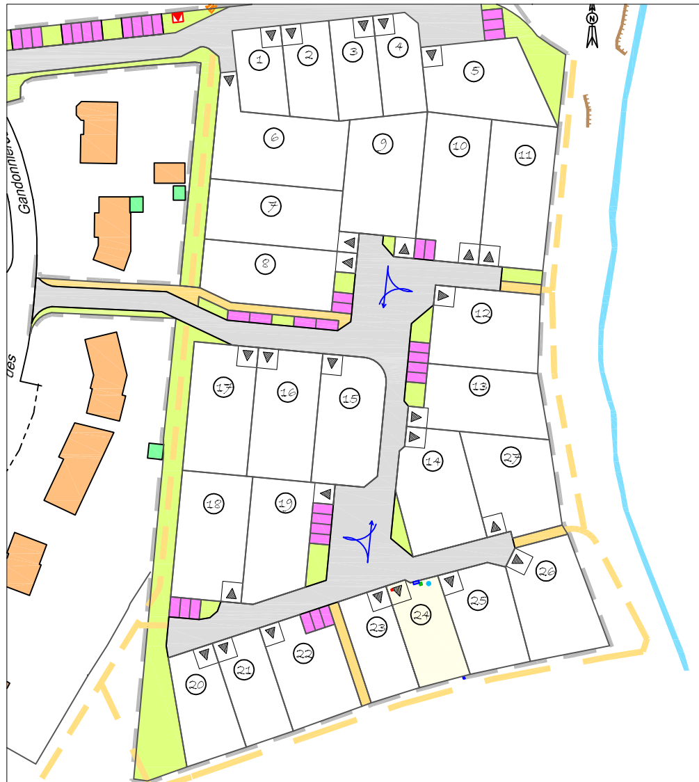
Plan général du lotissement ( sans échelle )